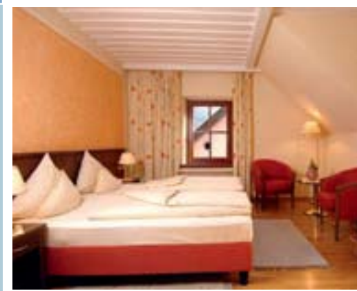
Unsere neuen Zimmer „Lebenslust“